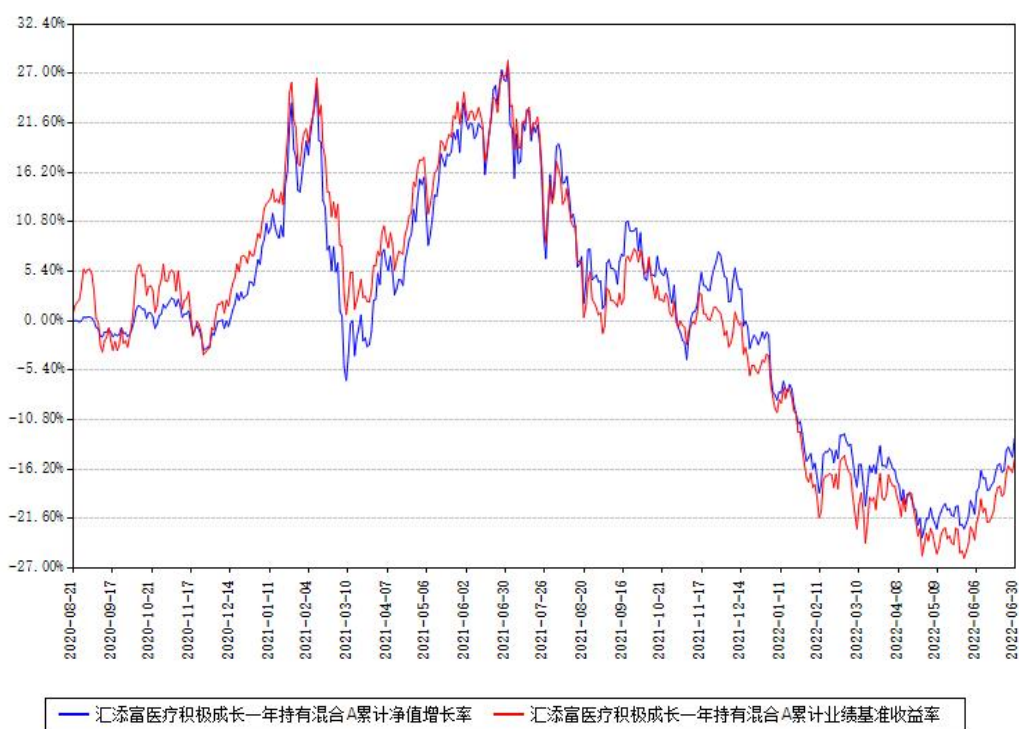
汇添富医疗积极成长一年持有混合A累计净值增长率与同期业绩基准收益率对比图