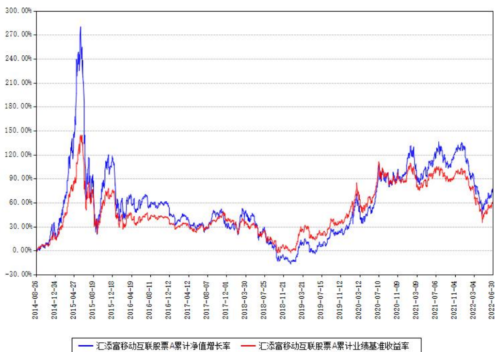
汇添富移动互联股票A累计净值增长率与同期业绩基准收益率对比图

(二) 自基金合同生效以来基金累计净值增长率变动及其与同期业绩比较基准收益率变动的比较图