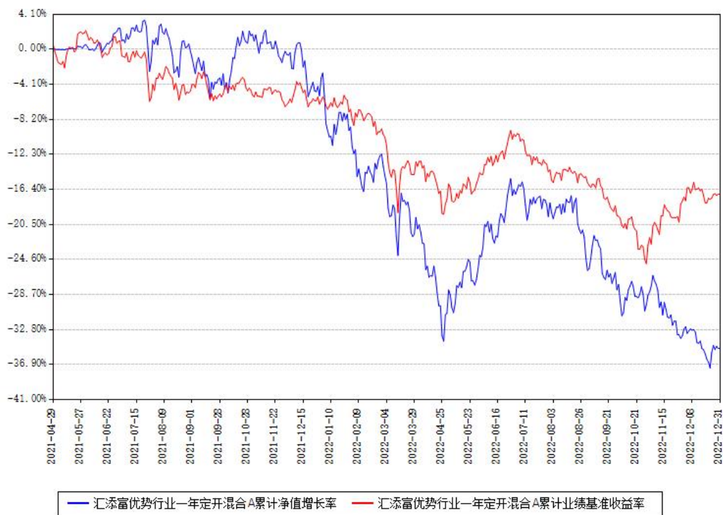
汇添富优势行业一年定开混合A累计净值增长率与同期业绩基准收益率对比图