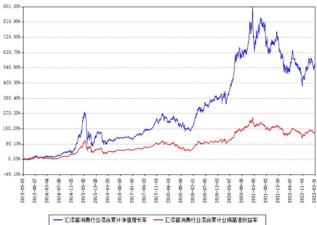
汇添富消费行业混合累计净值增长率与同期业绩基准收益率对比图