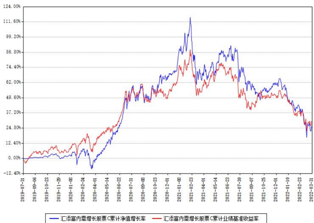
汇添富内需增长股票C累计净值增长率与同期业绩基准收益率对比图