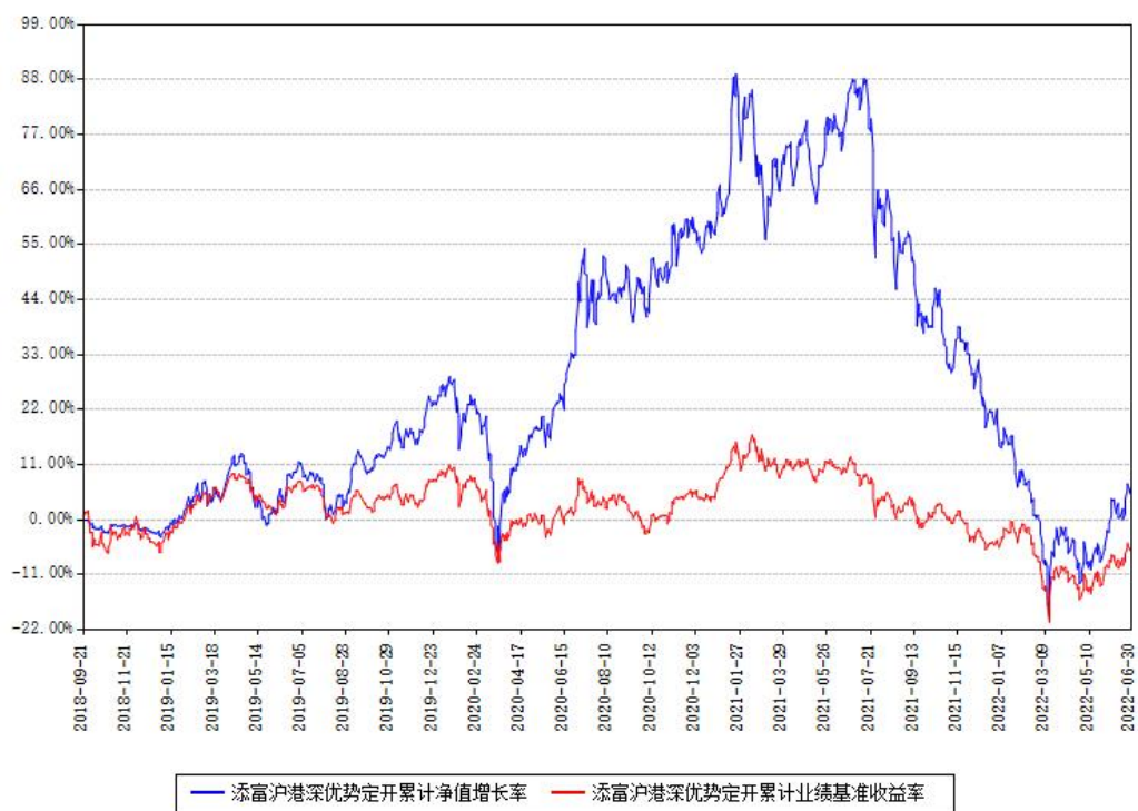
添富沪港深优势定开累计净值增长率与同期业绩基准收益率对比图