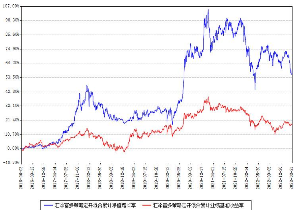
汇添富多策略定开混合累计净值增长率与同期业绩基准收益率对比图