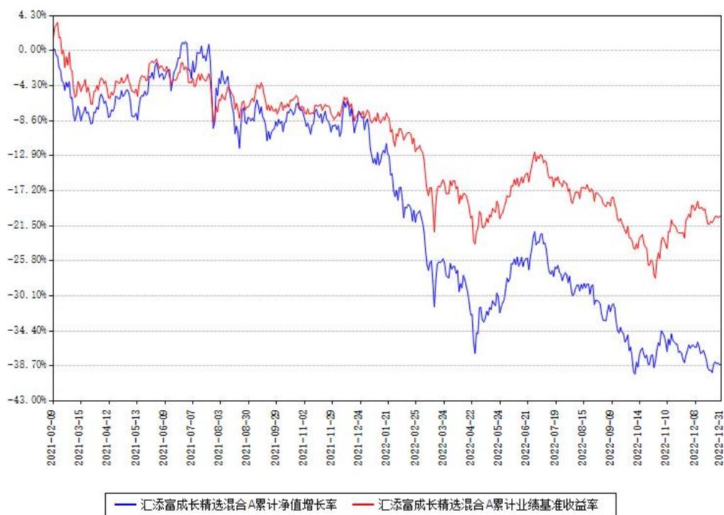
汇添富成长精选混合A累计净值增长率与同期业绩基准收益率对比图