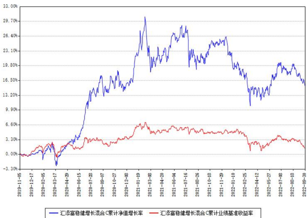
汇添富稳健增长混合C累计净值增长率与同期业绩基准收益率对比图