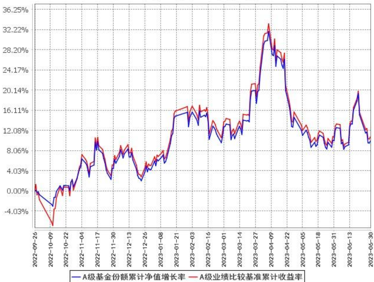
A级基金份额累计净值增长率与同期业绩比较基准收益率的历史走势对比图 (2022年9月26日至2023年6月30日)