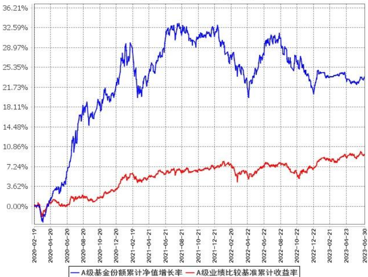
A级基金份额累计净值增长率与同期业绩比较基准收益率的历史走势对比图 (2020年2月19日至2023年6月30日)