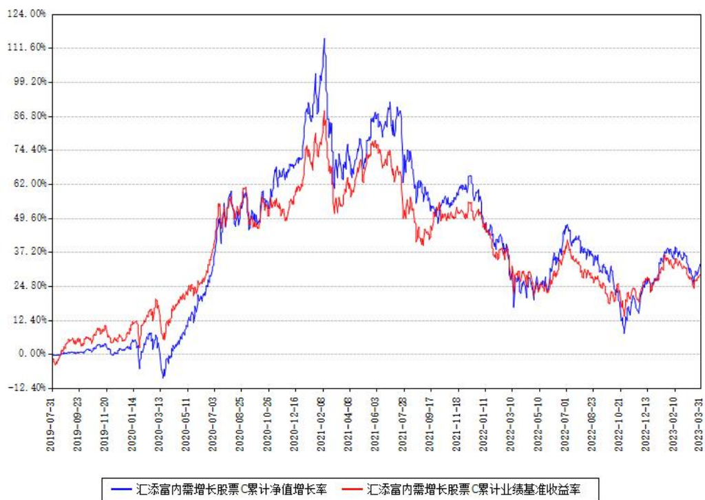
汇添富内需增长股票C累计净值增长率与同期业绩基准收益率对比图