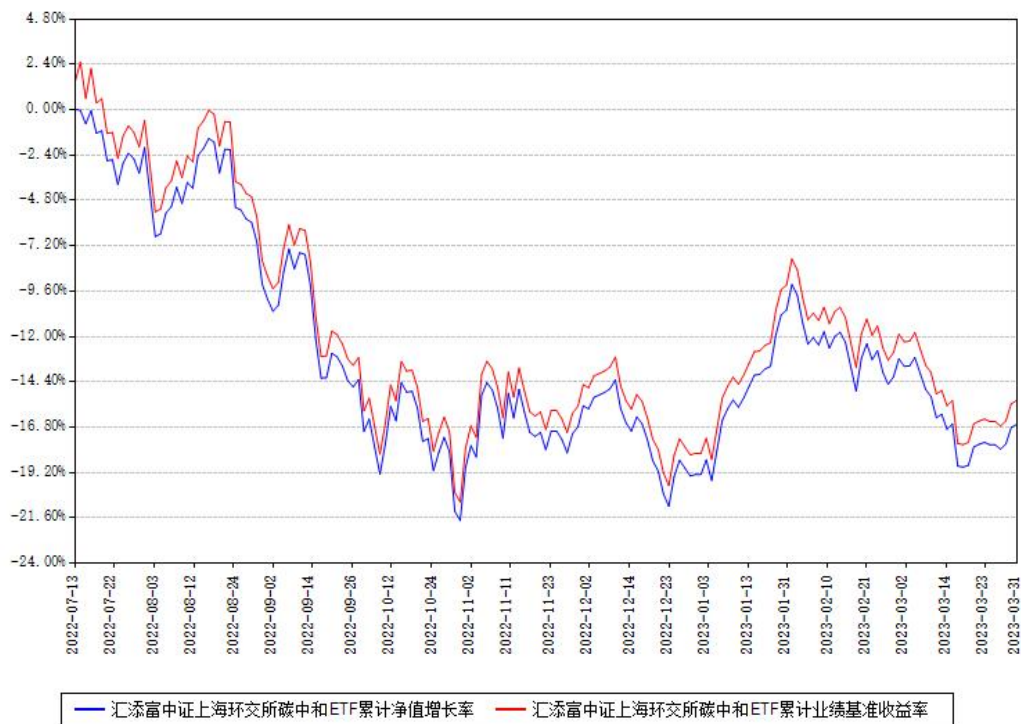
汇添富中证上海环交所碳中和ETF累计净值增长率与同期业绩基准收益率对比图

(二) 自基金合同生效以来基金累计净值增长率变动及其与同期业绩比较基准收益率变动的比较图