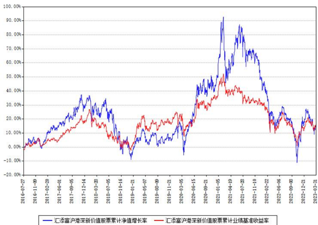
汇添富沪港深新价值股票累计净值增长率与同期业绩基准收益率对比图