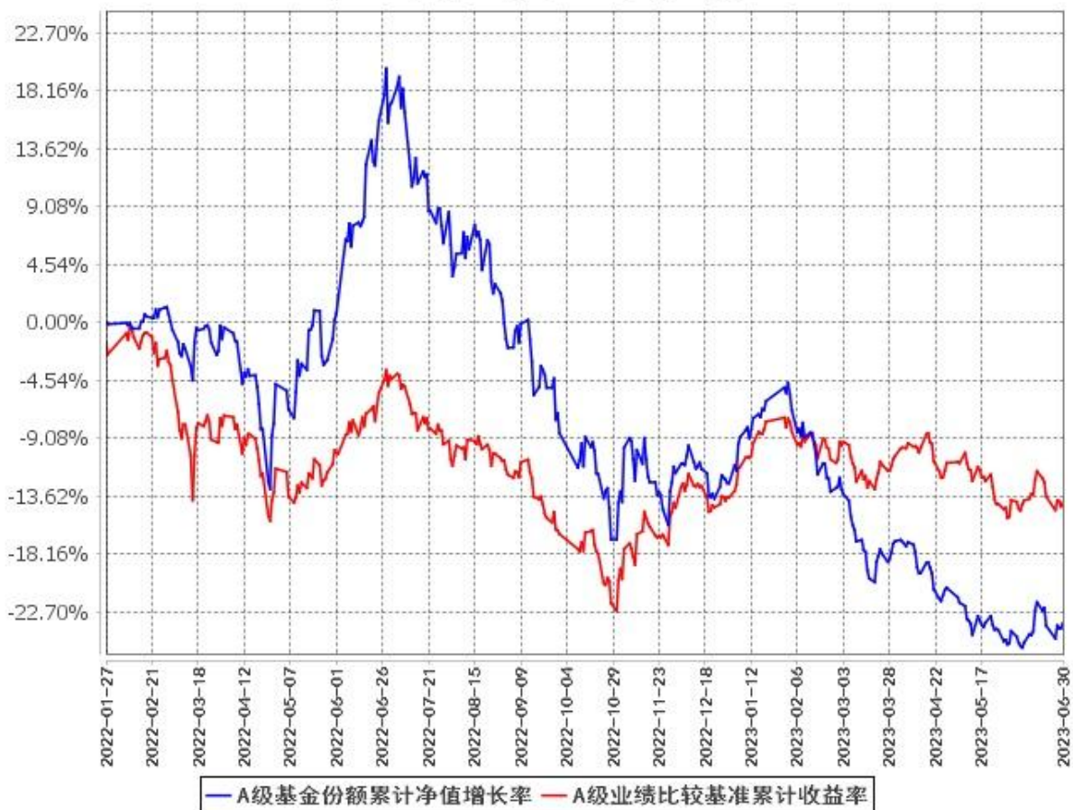
A级基金份额累计净值增长率与同期业绩比较基准收益率的历史走势对比图 (2022年1月27日至2023年6月30日)