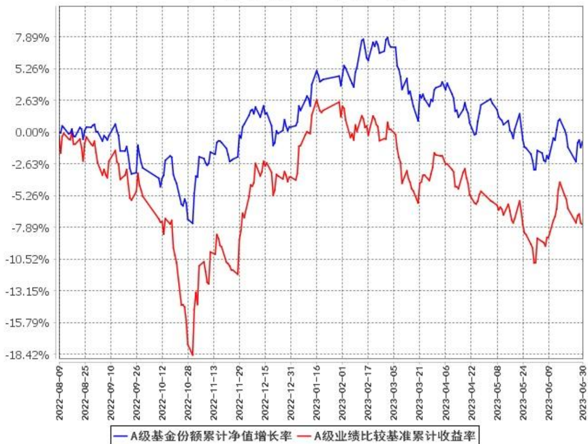
A级基金份额累计净值增长率与同期业绩比较基准收益率的历史走势对比图 (2022年8月9日至2023年6月30日)