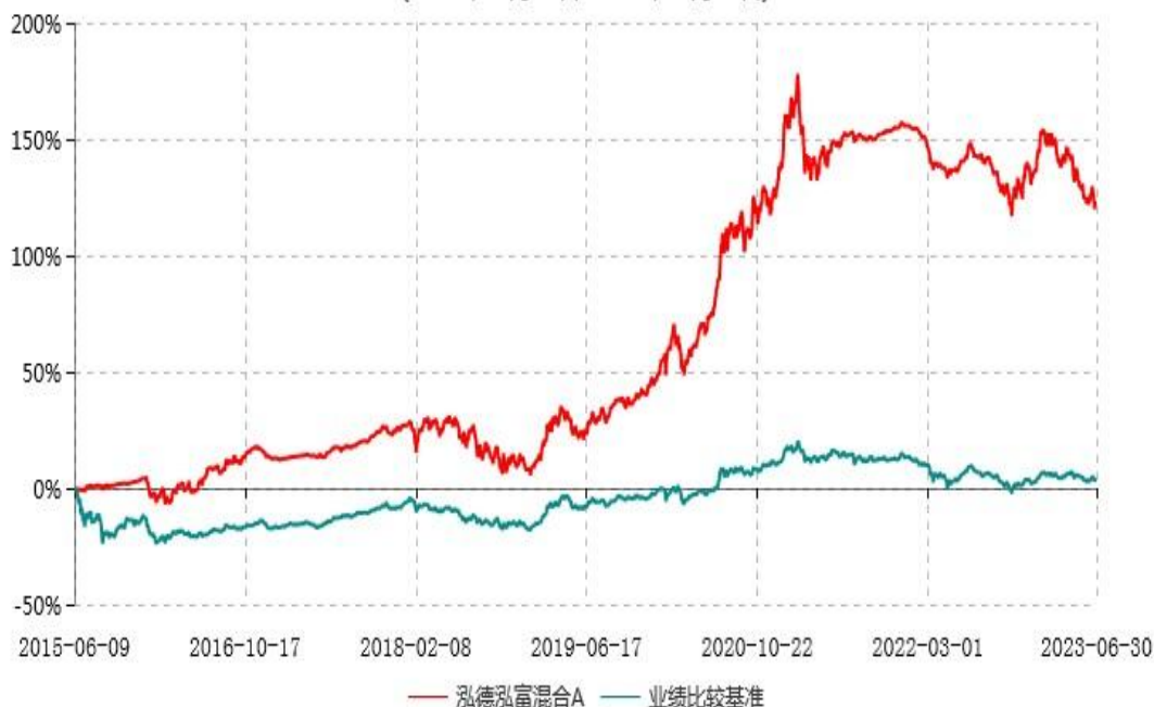
泓德泓富混合C累计净值增长率与业绩比较基准收益率历史走势对比图