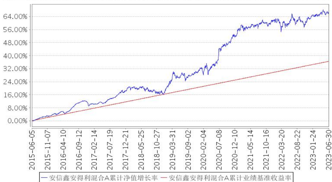
安信鑫安得利混合A累计净值增长率与同期业绩比较基准收益率的历史走势对比图