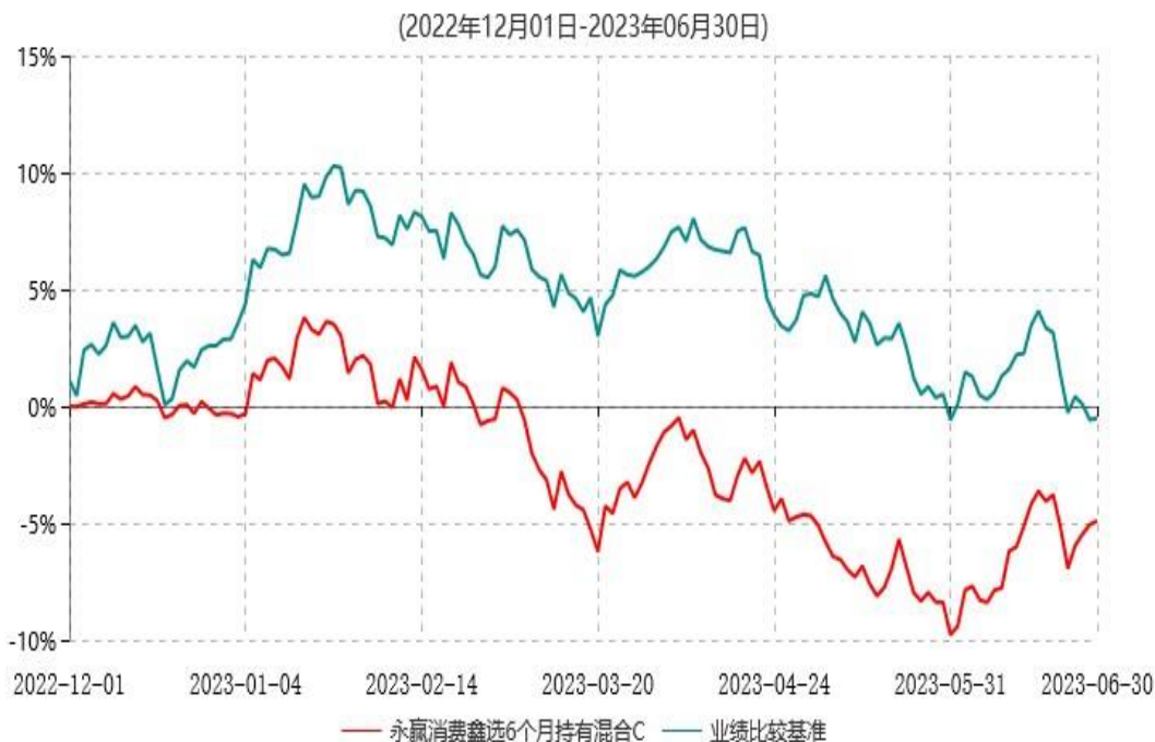
永赢消费鑫选6个月持有混合C累计净值增长率与业绩比较基准收益率历史走势对比图

注：1、本基金合同生效日为 2022 年 12 月 1 日，截至本报告期末本基金合同生效未满一年；