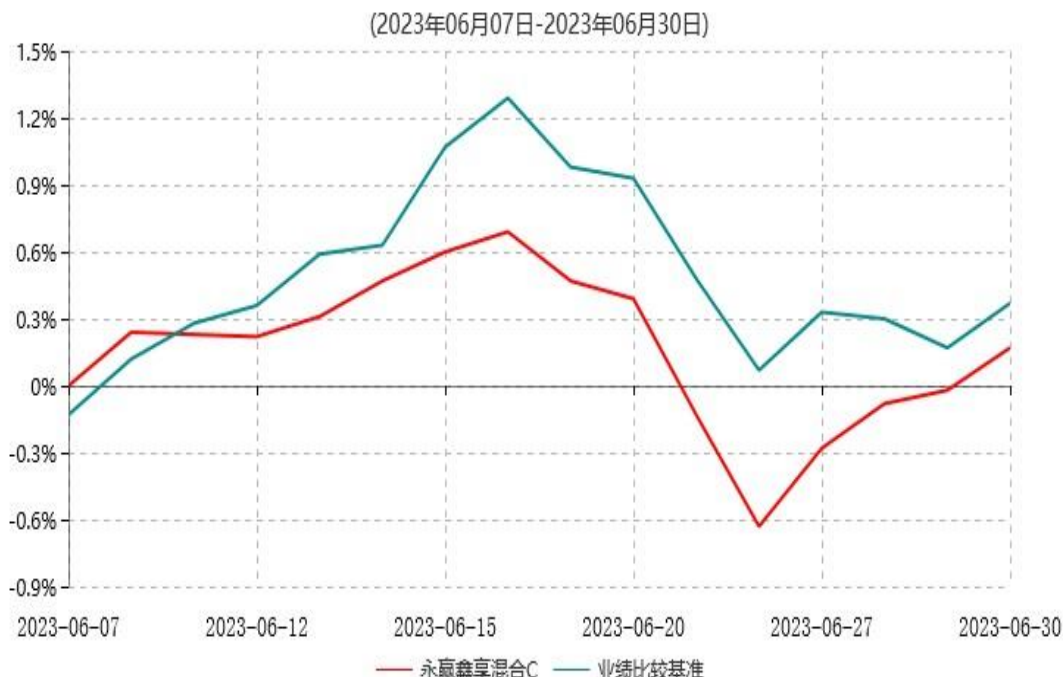
永赢鑫享混合C累计净值增长率与业绩比较基准收益率历史走势对比图

注：本基金自 2023 年 06 月 07 日增设 C 类份额，截至本报告期末，本类基金份额生效未 满一年。