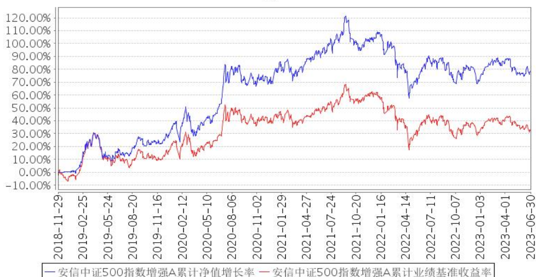
安信中证500指数增强A累计净值增长率与同期业绩比较基准收益率的历史走势对比图