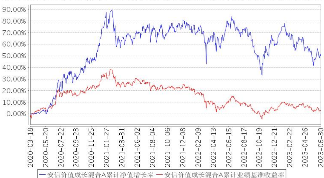
安信价值成长混合A累计净值增长率与同期业绩比较基准收益率的历史走势对比图