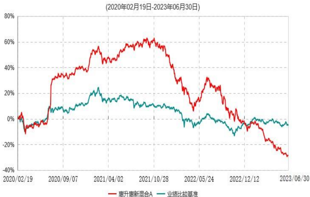
惠升惠新混合A累计净值增长率与业绩比较基准收益率历史走势对比图