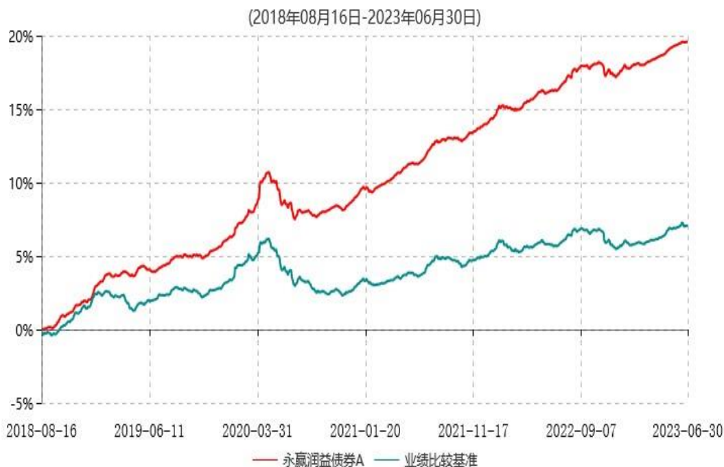
永赢润益债券A累计净值增长率与业绩比较基准收益率历史走势对比图