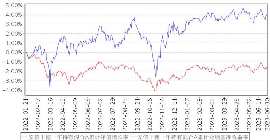
安信丰穗一年持有混合A累计净值增长率与同期业绩比较基准收益率的历史走势对比图