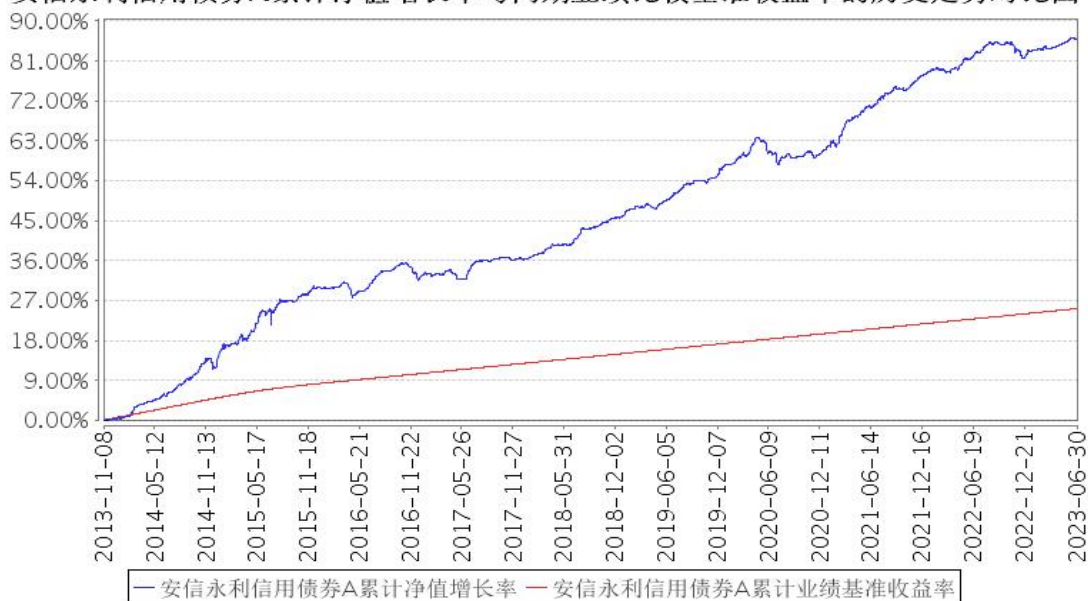
安信永利信用债券A累计净值增长率与同期业绩比较基准收益率的历史走势对比图