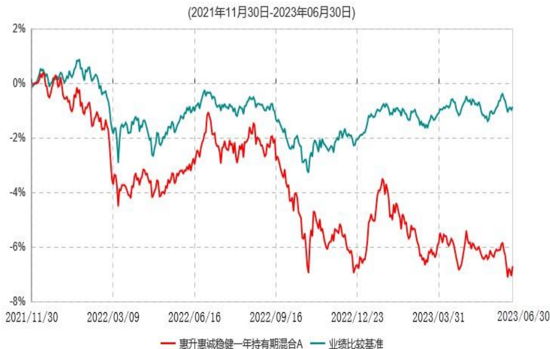
惠升惠诚稳健一年持有期混合A累计净值增长率与业绩比较基准收益率历史走势对比图