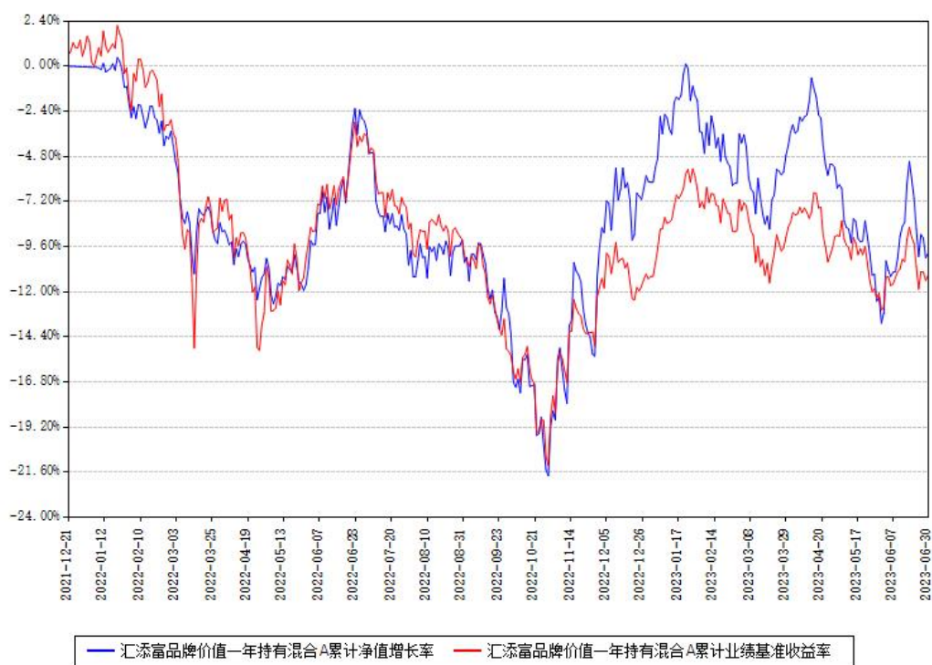
汇添富品牌价值一年持有混合A累计净值增长率与同期业绩比较基准收益率对比图