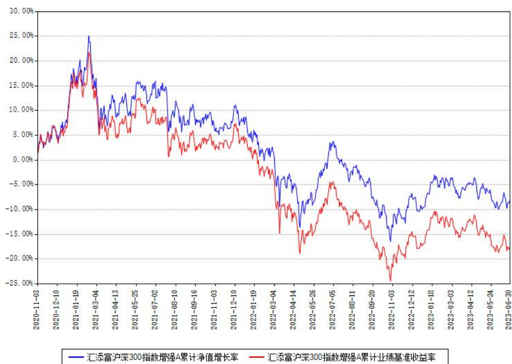
汇添富沪深300指数增强A累计净值增长率与同期业绩基准收益率对比图