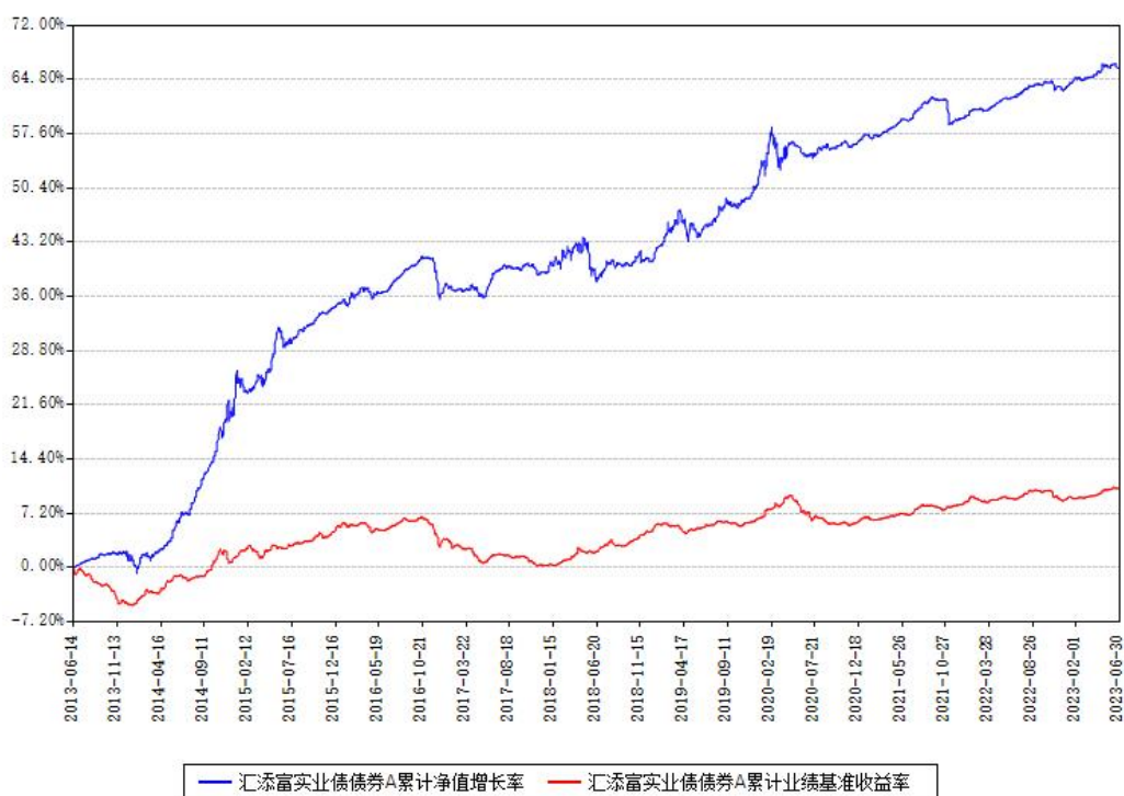
汇添富实业债债券A累计净值增长率与同期业绩比较基准收益率对比图