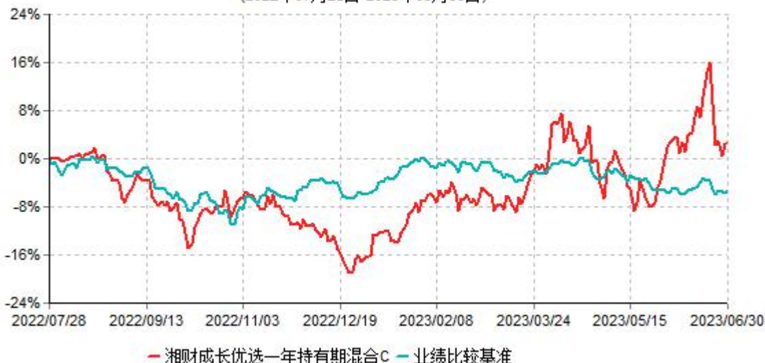
湘财成长优选一年持有期混合C累计净值增长率与业绩比较基准收益率历史走势对比图 (2022年07月28日-2023年06月30日)