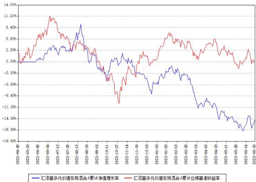
汇添富多元价值发现混合A累计净值增长率与同期业绩基准收益率对比图