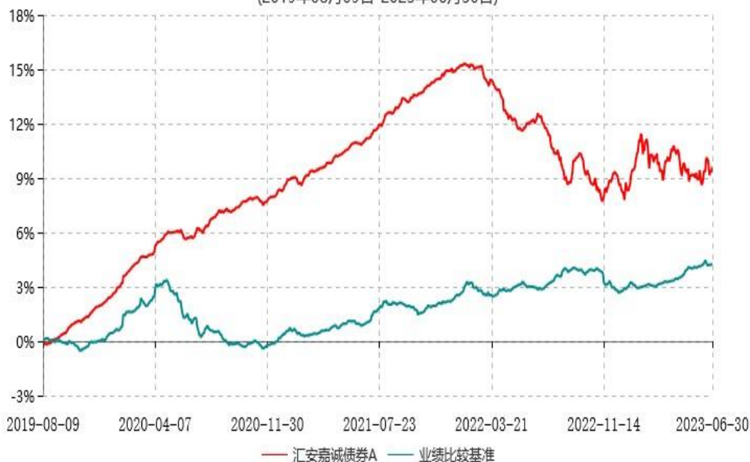
汇安嘉诚债券C累计净值增长率与业绩比较基准收益率历史走势对比图