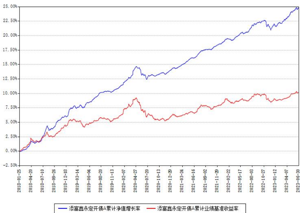
添富鑫永定开债A累计净值增长率与同期业绩基准收益率对比图