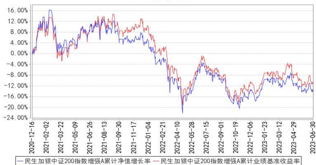
民生加银中证 200 指数增强 A 累计净值增长率与同期业绩比较基准收益率的历史走势对比图