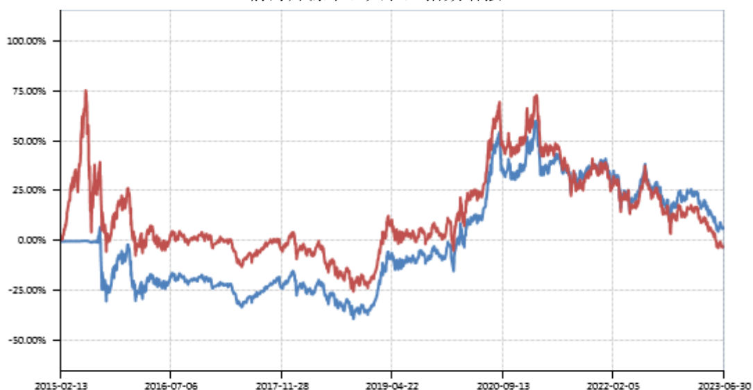
前海开源中证大农业指数增强 A