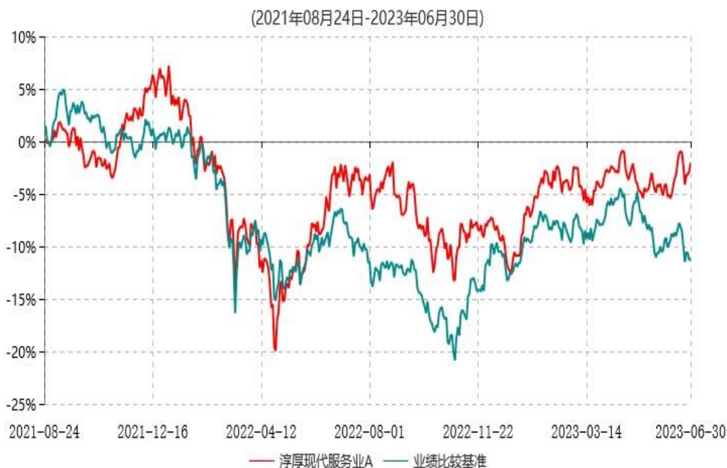
淳厚现代服务业A累计净值增长率与业绩比较基准收益率历史走势对比图

注：本基金基金合同生效日为 2021 年 08 月 24 日。按基金合同规定，本基金自基金合同生效起 6 个月内为建仓期。建仓期结束时本基金的各项投资比例均符合基金合同约定。