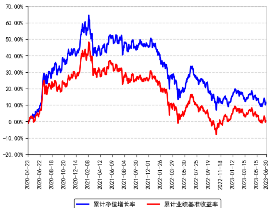
南方沪深300指数增强A累计净值增长率与同期业绩比较基准收益率的历史走势对比图