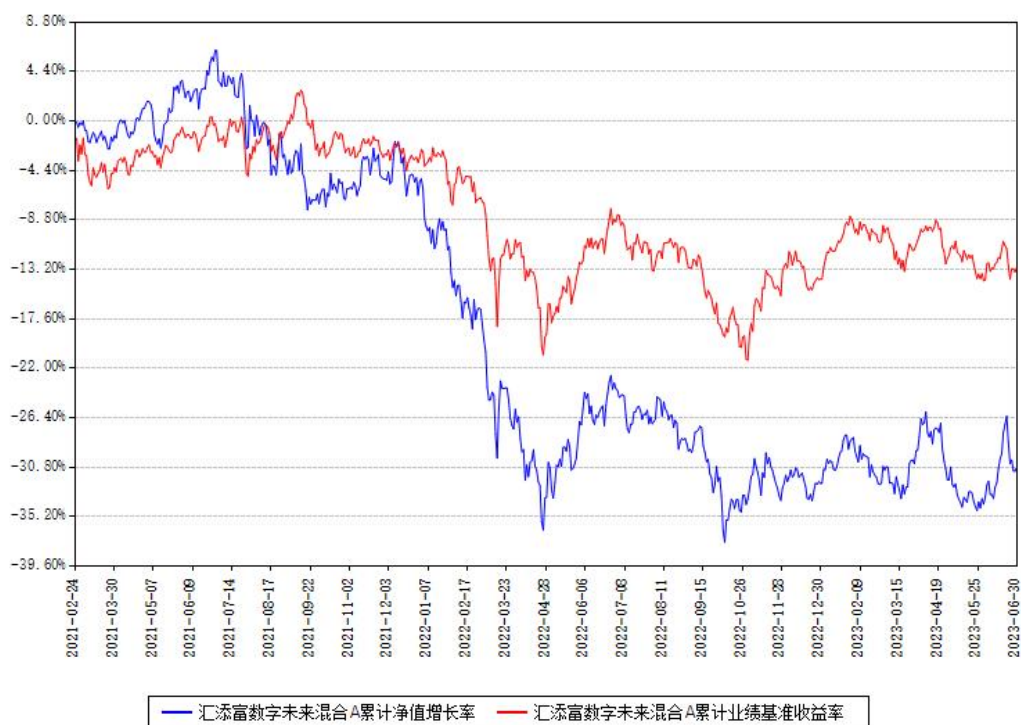
汇添富数字未来混合A累计净值增长率与同期业绩比较基准收益率对比图