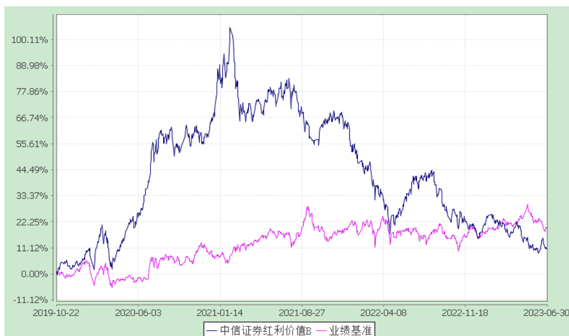
中信证券红利价值C: