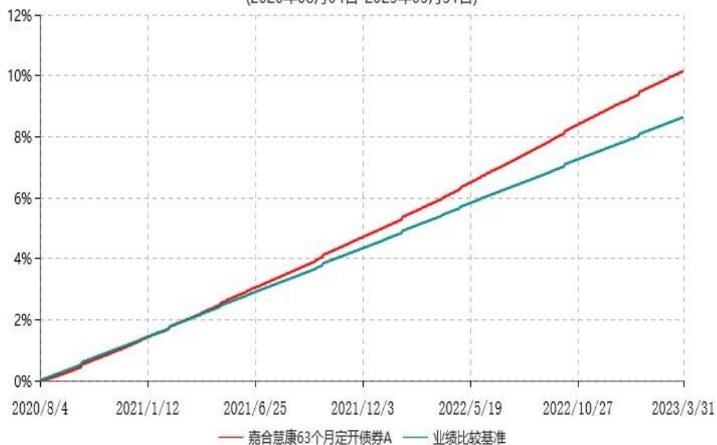
嘉合慧康63个月定开债券A累计净值增长率与业绩比较基准收益率历史走势对比图 (2020年08月04日-2023年03月31日)

(二) 自基金合同生效以来基金累计净值增长率变动及其与同期业绩比较基准收益率变动的比较