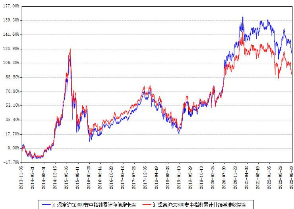
汇添富沪深300安中指数累计净值增长率与同期业绩基准收益率对比图