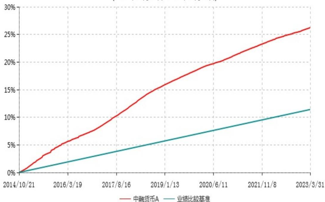
中融货币A累计净值收益率与业绩比较基准收益率历史走势对比图 (2014年10月21日-2023年03月31日)