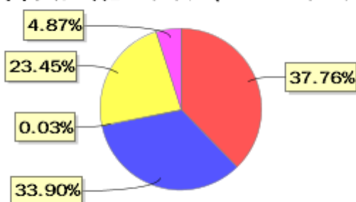
投资组合资产配置图表(2023年6月30日)

● 固定收益投资 ● 买入返售金融资产 ● 其他资产 ● 权益投资 ● 银行存款和结算备付金合计