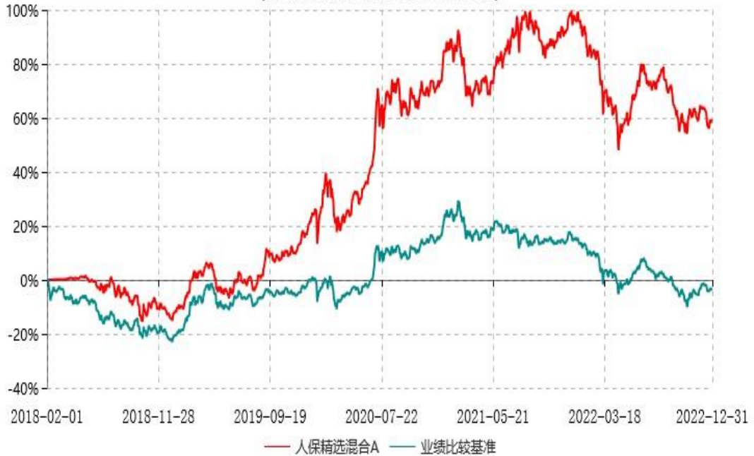
人保精选混合C累计净值增长率与业绩比较基准收益率历史走势对比图