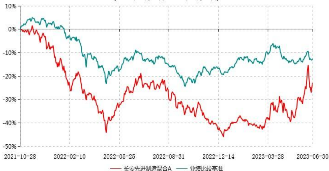
长安先进制造混合A累计净值增长率与业绩比较基准收益率历史走势对比图 (2021年10月28日-2023年06月30日)

根据基金合同的规定,自基金合同生效之日起6个月内基金各项资产配置比例需符合基金合同要求。本基金在建仓期结束后,各项资产配置比例已符合基金合同有关投资比例的约定。图示日期为2021年10月28日至2023年06月30日。