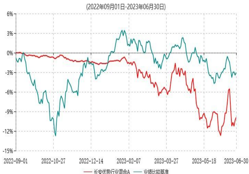
长安优势行业混合A累计净值增长率与业绩比较基准收益率历史走势对比图

根据基金合同的规定,自基金合同生效之日起6个月内基金各项资产配置比例需符合基金合同要求。本基金在建仓期结束后,各项资产配置比例已符合基金合同有关投资比例的约定。本基金于2022年9月1日成立,基金合同生效日至报告期末,本基金运作时间未满一年。图示日期为2022年9月1日至2023年6月30日止。