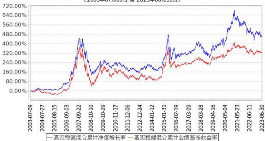
图：嘉实稳健混合份额累计净值增长率与同期业绩比较基准收益率的历史走势对比图