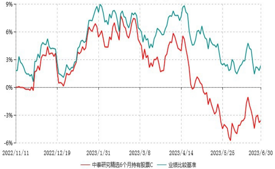
中泰研究精选6个月持有股票C累计净值增长率与业绩比较基准收益率历史走势对比图 (2022年11月11日-2023年06月30日)