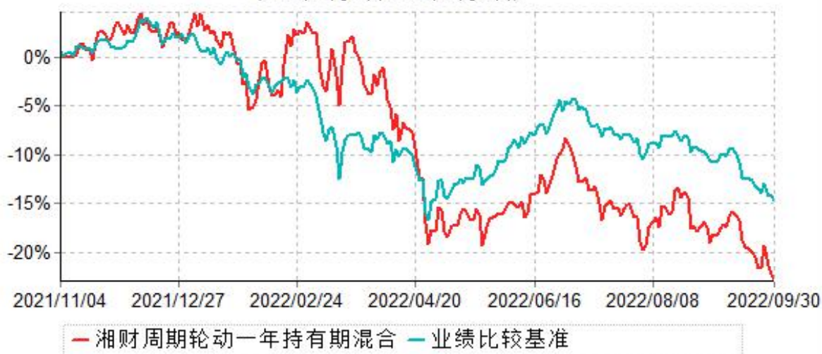
湘财周期轮动一年持有期混合型证券投资基金累计净值增长率与业绩比较基准收益率历史走势对比图 (2021年11月04日-2022年09月30日)

1、本基金合同于2021年11月4日生效，截至本报告期末，本基金基金合同生效未满一年。